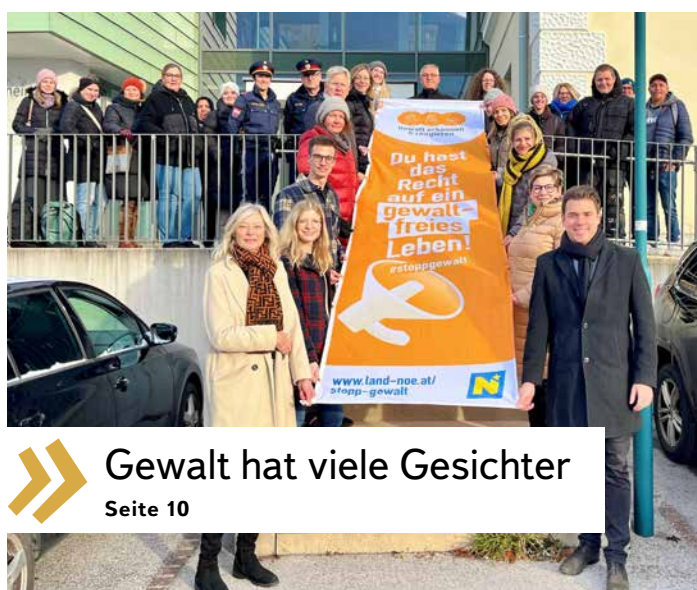
» Gewalt hat viele Gesichter Seite 10