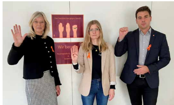
Das „stille Handzeichen“, mit dem Betroffene unauffällig auf akute Gefahr aufmerksam machen können.