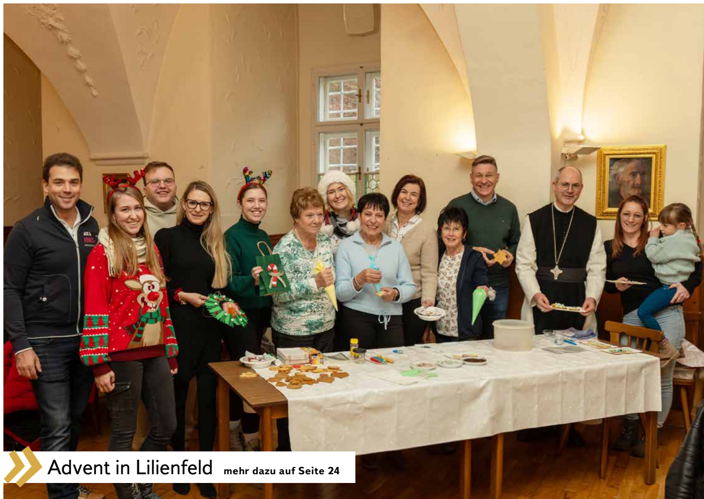
» Advent in Lilienfeld mehr dazu auf Seite 24