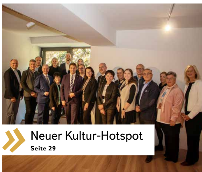
» Neuer Kultur-Hotspot Seite 29